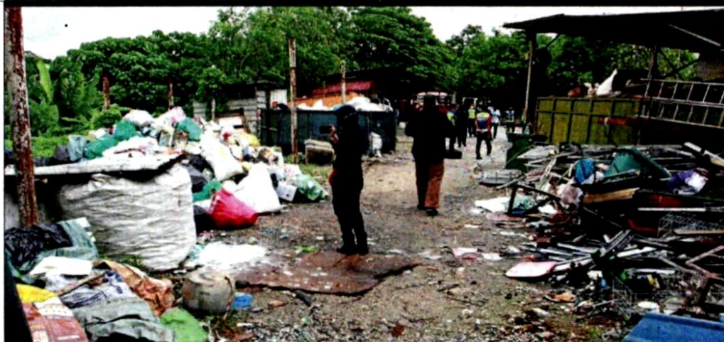
Broken home appliances among items found at the site.