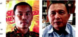
Rafiq says all Fire stations are on high alert and ready for rescue work in case of flash floods.