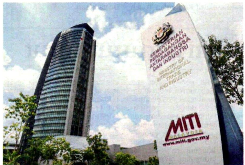
KEMENTERIAN Perdagangan Antarabangsa dan Industri akan menggerakkan usaha untuk menjayakan matlamat di bawah RMK12.

Tambah beliau, peruntukan sebanyak RM400 bilion menzahirkan komitmen kerajaan untuk mendepani cabaran-cabaran