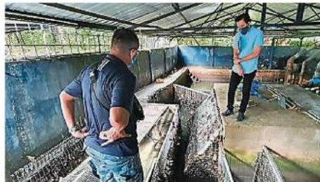
当局认为排水系统受阻，可能是造成水灾的肇因之一。

哈利梅表示，他也有向雪州水务管理公司提出建议，要求在该区置放一个大水槽，以方便居民清洗住家。