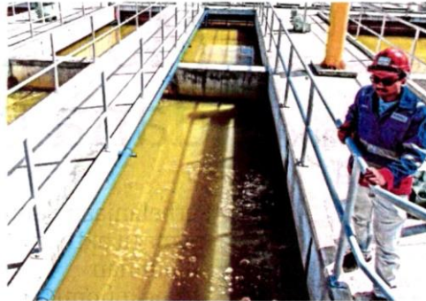
Loji Rawatan Air Langat 2 di Hulu Langat.