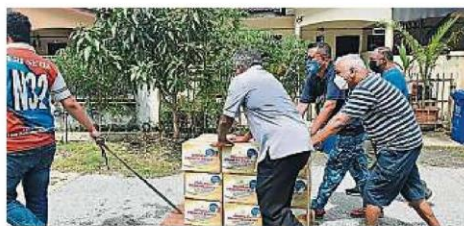
除了义工前来协助，附近的邻居也守望相助，一起搬运物资给灾黎。