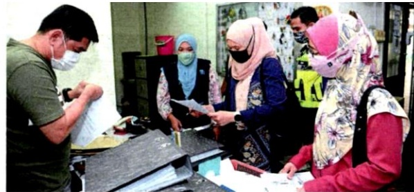
The MBSJ team examining documents during an audit compliance check at a JMB office.

Among the documents examined were minutes of the annual general meeting, minutes of committee member meetings, service