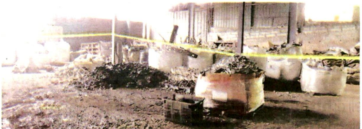
SEBAHAGIAN besi buruk sedia dilebur disita di sebuah kilang di Alam Impian, Shah Alam semalam.

“Jika disabitkan kesalahan, boleh dikenakan hukuman denda tidak lebih daripada RM100,000 atau penjara sehingga maksimum lima tahun atau kedua-duanya,” katanya.