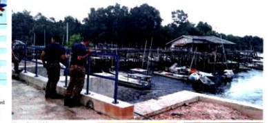
Klang Fire and Rescue Department's equipment for relief work are on standby, including boats and life jackets.

Port Klang Fire and Rescue Station Chief Rafiq Mohamed Harts said all stations in the district were on high alert and being prepared to handle any possible disasters.