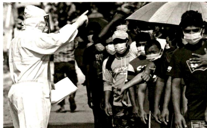
KOS kit ujian pantas yang perlu ditanggung oleh kontraktor bagi semua pekerja asing di tapak projek pembinaan dilihat membebankan.

dan menilai semula SOP bagi fasa endemik ini dengan melihat pendekatan yang boleh diambil. Sebelum ini, beberapa negara telah melonggarkan secara keseluruhan SOP. Namun, tindakan tersebut