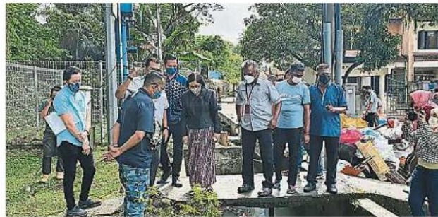
求 解 决 方 案。 梅 (左二)到沙亚南亲善花园巡视，以手 由 于 沙 亚 南 多 区 日 前 午 后 大 雨 后 水